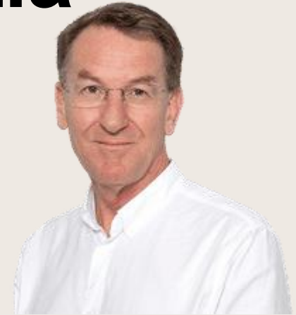
Paul Chadwick The Guardian