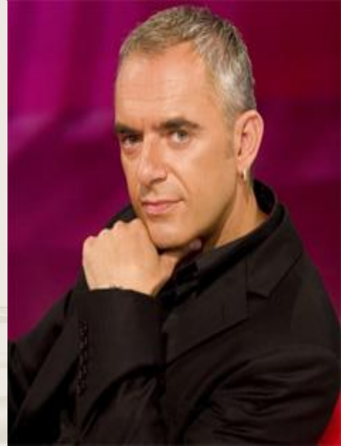
Xabier Eguzkitze (Deia)

-Hortaz: iritzi ezberdinek euren lekua duten arren, zutabe gehienek aintzat hartzen dute kazetaren ildo editoriala.