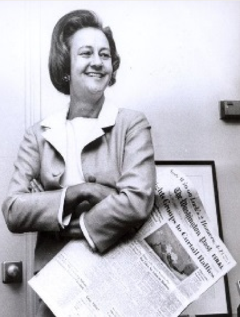
Katharine Graham (1917-2001)