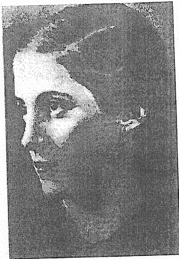
Pilar Primo de Rivera