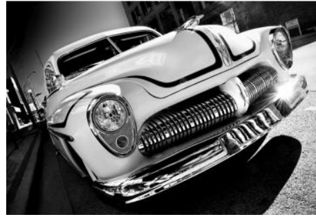
Aberrante, itxuragabea edo holandarra

Ardatz horizontalean kamera okertuz, ardatz horizontala eta bertikala ez dira irudiak erakutsiko duen eszenarekin bat etorriko. Honek ezegonkortasun eta oreka falta iradokitzen ditu eta baliabide adierazgarri moduan erabili daiteke.